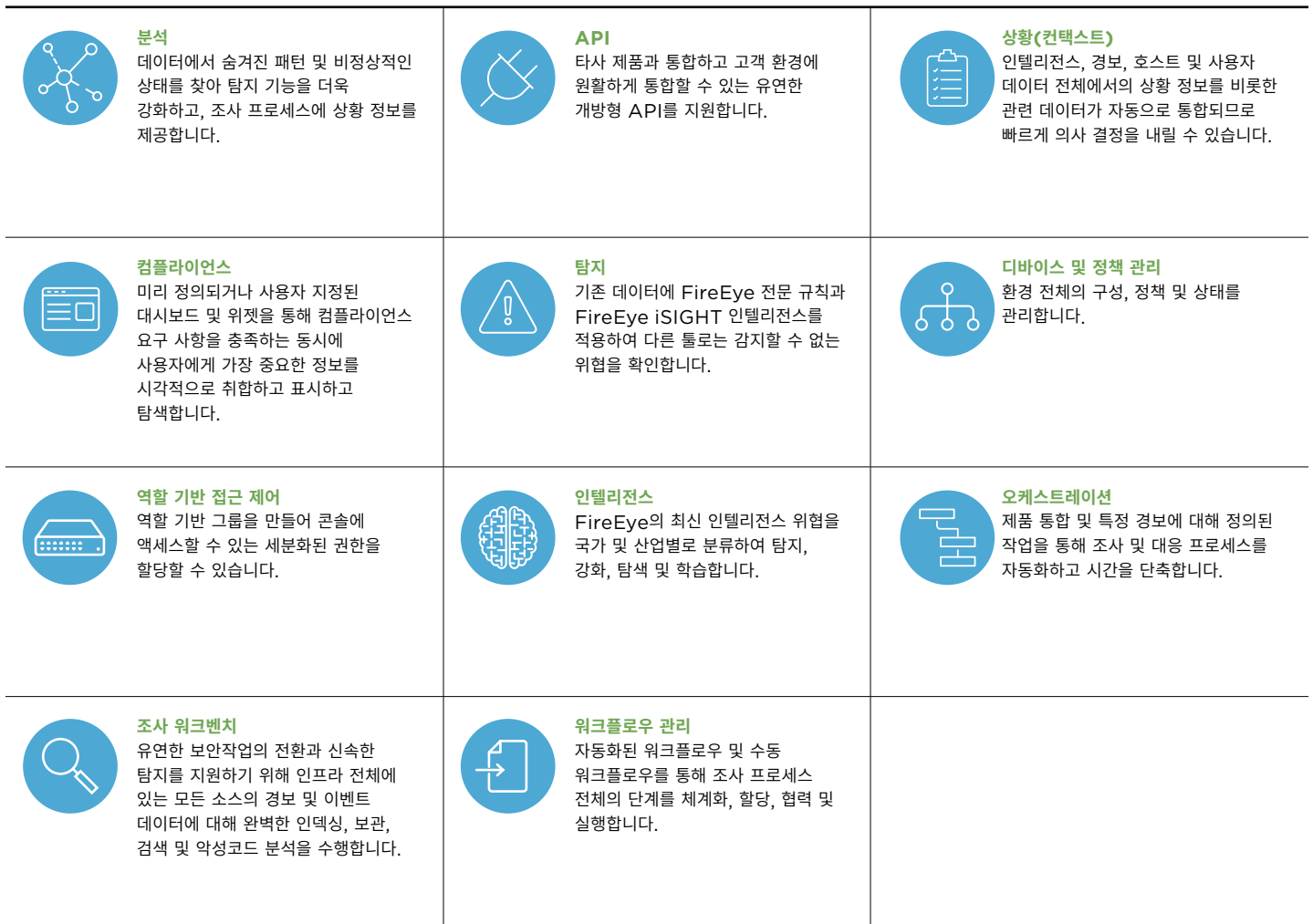
그림 2. FireEye Helix의 기능

FireEye에 대한 더 자세한 정보를 원하시면 다음의 웹사이트를 방문하십시오.